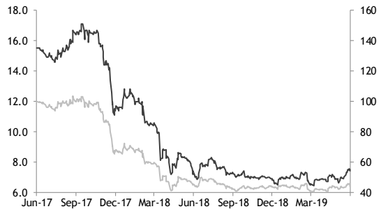
— M.C.S. Steel - (LHS, THB) — M.C.S. Steel / Stock Exchange of Thai Index - (RHS, %)